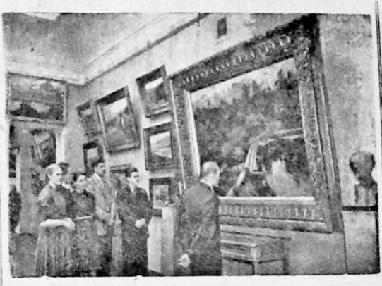
Москва. Исполнилось 100 лет со дня основания Государственной Третьяковской галереи. С самого своего возникновения галерея является средоточием передового русского искусства. Но лишь в советское время она стала подлинно массовым художественно-просветительным центром. Декрет о национализации галерей от 3 июня 1918 года, подписанный Владимиром Ильичем Лениным, свидетельствует об общегосударственном и общенародном значении сокровищницы русского искусства. В залах галереи представлены замечательные произведения русской дореволюционной и советской живописи, графики, скульптуры. Здесь устраиваются персональные выставки великих русских художников, на которых экспонируются произведения, привезенные со всех концов Советского Союза. Периодически организуются всесоюзные выставки, дающие возможность следить за ходом развития советского искусства. Большой коллектив научных работников занимается углубленным изучением творчества дореволюционных и советских художников. На должном научном уровне ведется реставрационная работа. Совершенствуется методика экскурсионной работы. В своей деятельности галерея связана с многочисленными московскими школами, заводами, учебными заведениями. Миллионы экскурсантов — москвичей, приезжих из разных уголков нашей страны, иностранцев — прослушали здесь беседы и лекции, познакомились с лучшими произведениями выдающихся русских мастеров и советских художников. На снимке: посетители галереи осматривают картину И. И. Левитана «У омуля».